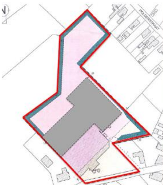
Contour gemeentelijk RUP Op-Sinjoorke Met aanduiding van de bestaande bebouwing