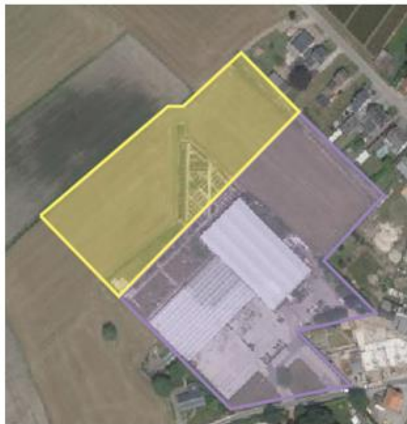
Contour aanvraag op luchtfoto Geel = zone voor landbouw Paars = zone voor bedrijvigheid