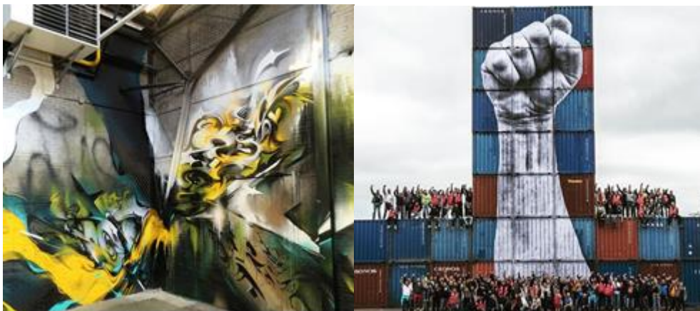
Digital DoesMathieu Kso