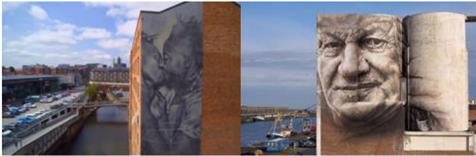
Faith47Guido van Helten