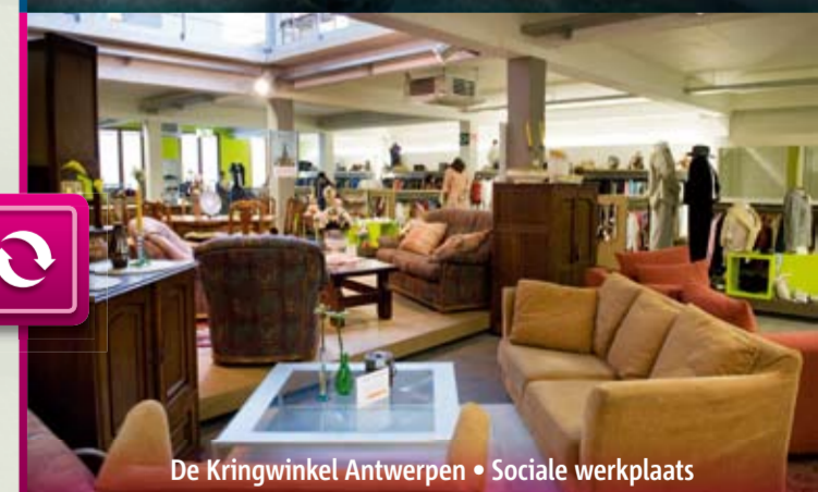
De Kringwinkel Antwerpen • Sociale werkplaats