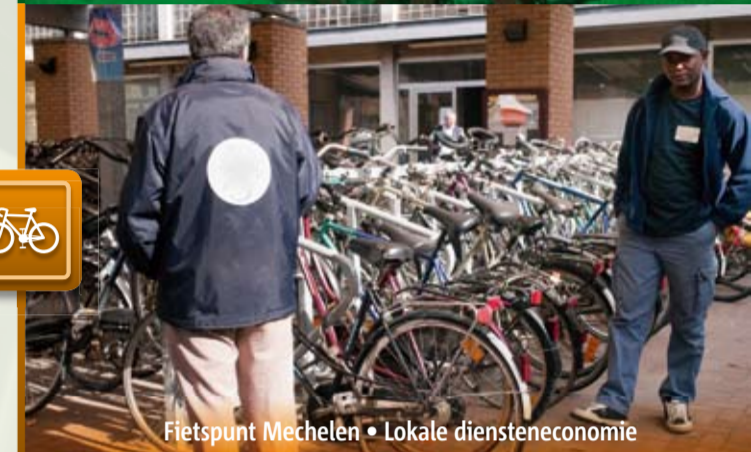
Fietspunt Mechelen • Lokale diensteneconomie