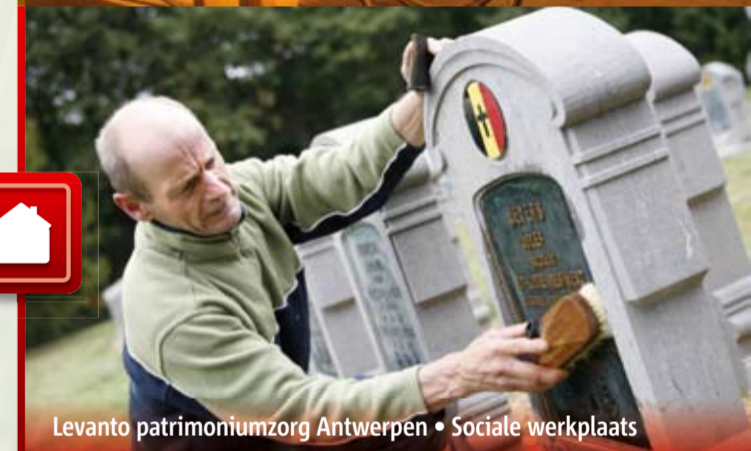
Levanto patrimoniumzorg Antwerpen • Sociale werkplaats