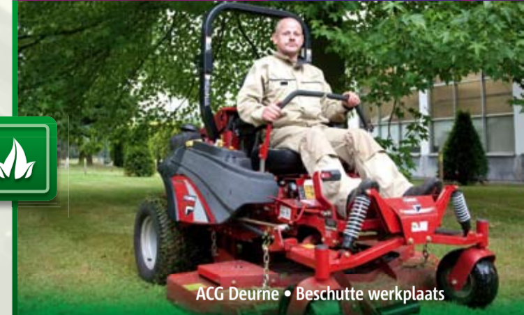
ACG Deurne • Beschutte werkplaats