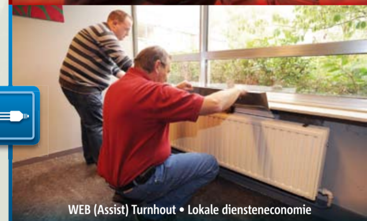
WEB (Assist) Turnhout • Lokale diensteneconomie