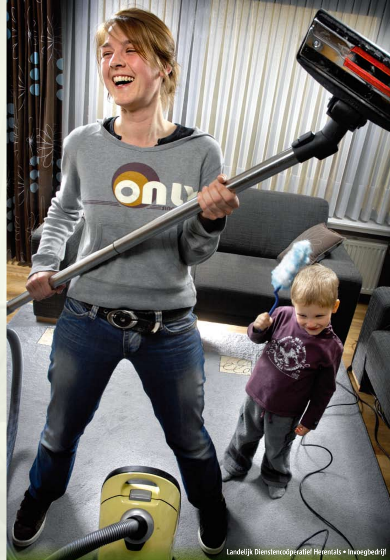
Landelijk Dienstencoöperatief Herentals • Invoegbedrijf