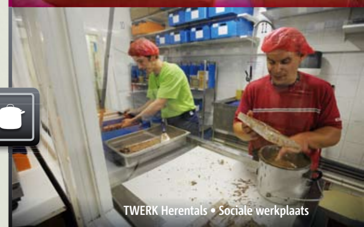
TWERK Herentals • Sociale werkplaats