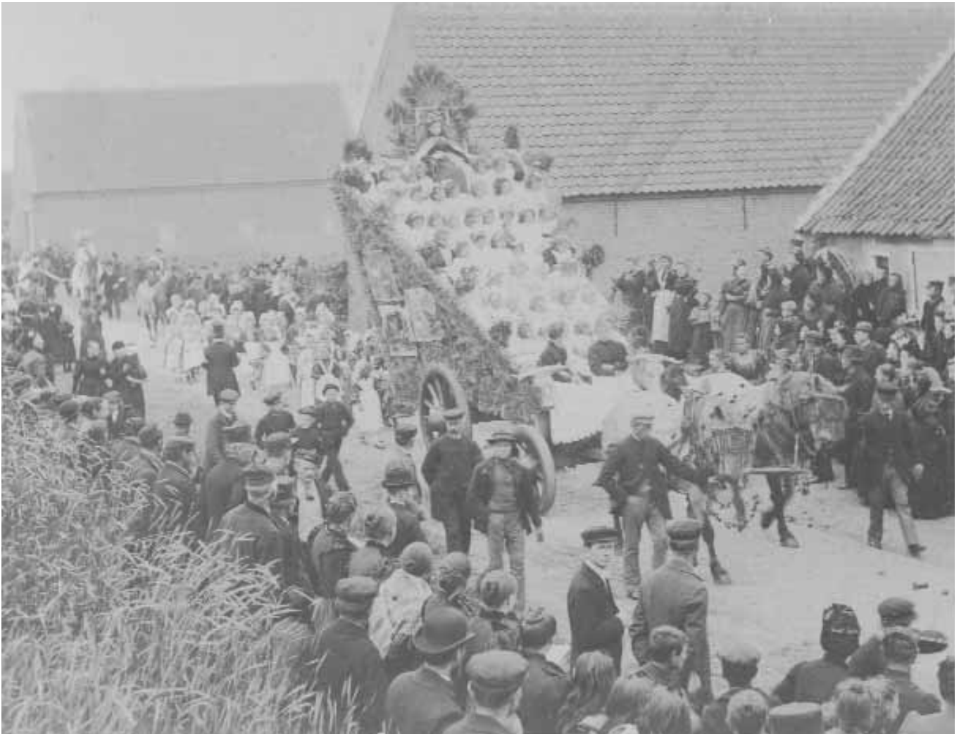
Een van de praalwagens van de stoet van 1898 met de mythologische figuur Pomona, de godin van de overvloed