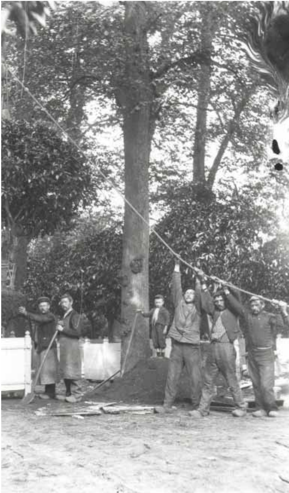
Het verplanten van de sinaasappelbomen door de tuiniers en de sterkste mannen uit het dorp