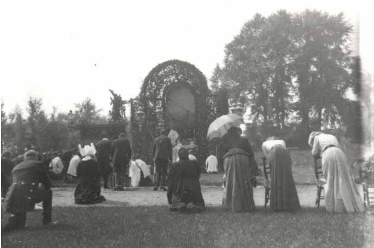
De hertogelijke familie op het einde van de 19de eeuw tijdens een van de processies plechtig geknielend voor het rustaltaar in het park