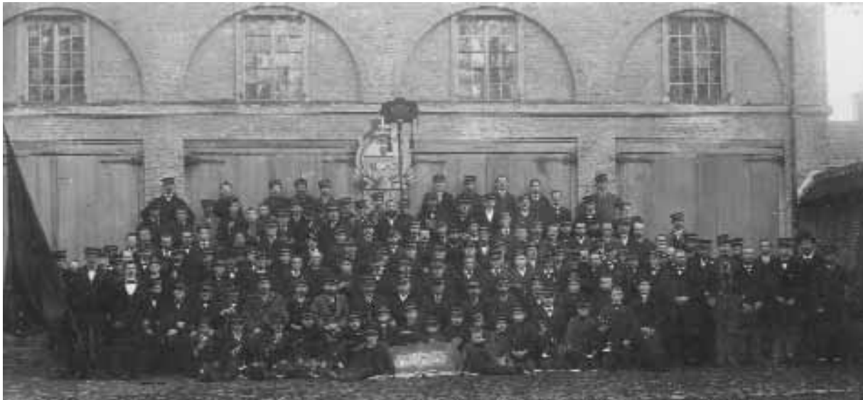
De zangmaatschappijen Vrede en Vrede Best uit Hingene en Wintam, een aangelegenheid voor jong en oud, maar uitsluitend voorbehouden voor het mannelijk geslacht