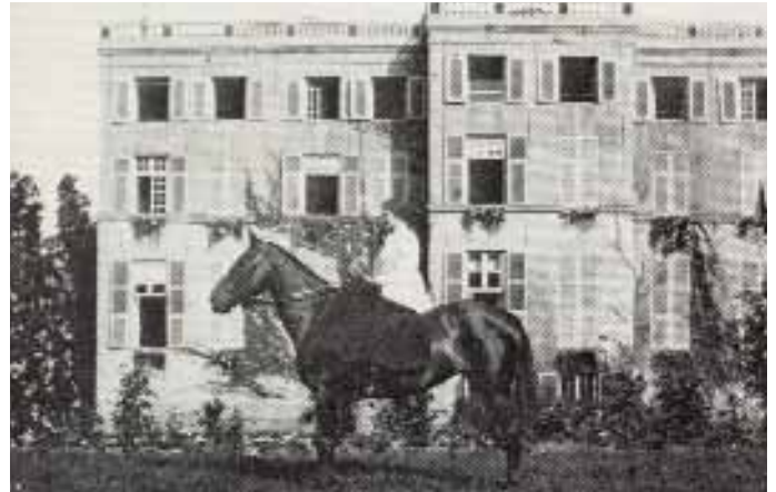
Hedwige d'Ursel als amazone in de tuin van het kasteel

Met veelkleurig zand maakte Dhartes volgens de Gentse traditie, tot bewondering van de genodigden van de hertog, grote zandtapijten die het wapenschild van de familie voorstelden en die driemaal per jaar vernieuwd werden.