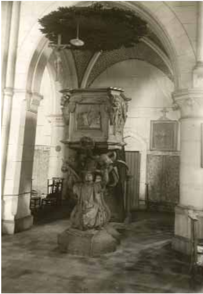
Het interieur van de Sint-Stephanuskerk met de neogotische beschildering van 1911