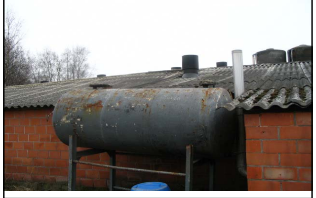
Opslag mazout 2.000 liter