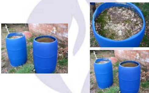
Kleverige oude kalkopslag