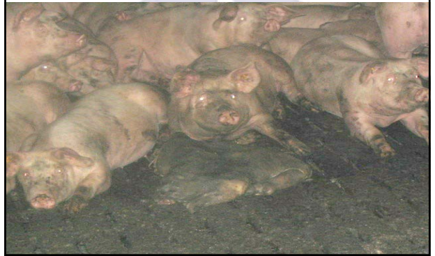
Overvolle mestkelder, kregen