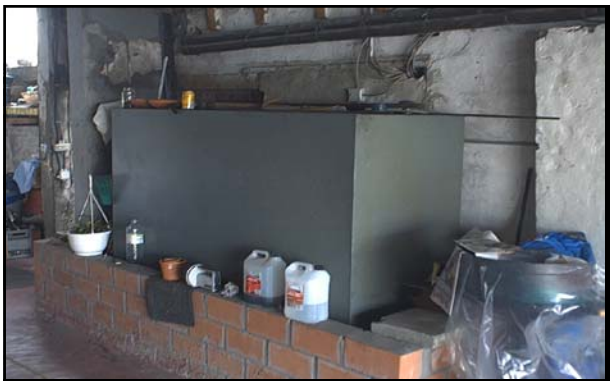
inkuiping te klein