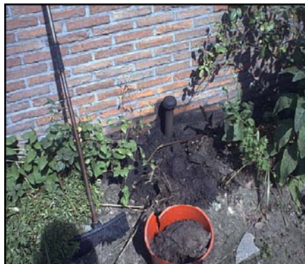
mazout'lek' via ontluchting *