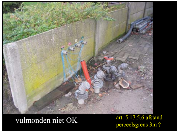
vulmonden niet OK

art. 5.17.5.6 afstand perceelsgrens 3m ?