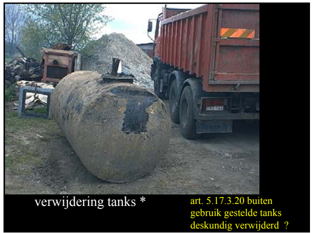
verwijdering tanks *

art. 5.17.3.20 buiten gebruik gestelde tanks deskundig verwijderd ?