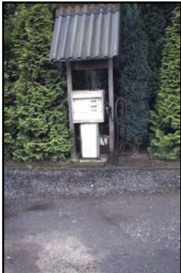
geen tankvloer *