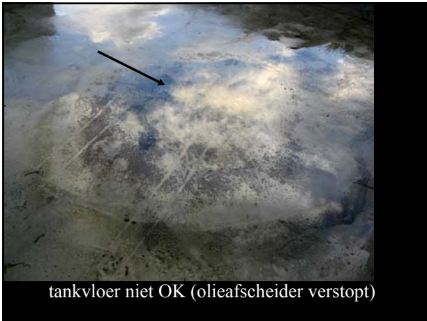
tankvloer niet OK (olieafscheider verstopt)

art. 5.17.3.20 buiten gebruik gestelde tanks deskundig verwijderd ?