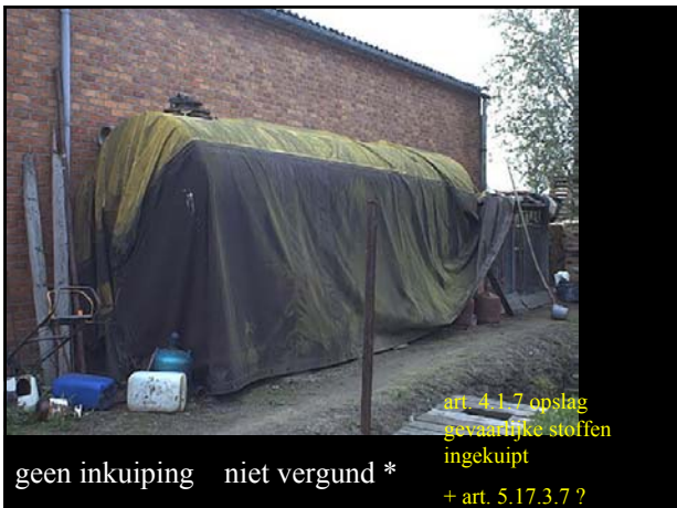
geen inkuiping niet vergund *

art. 4.1.7 opslag gevaarlijke stoffen ingekuipt