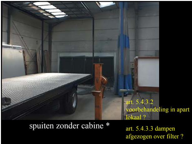
spuiten zonder cabine *

art. 5.4.3.2 voorbehandeling in apart lokaal ?